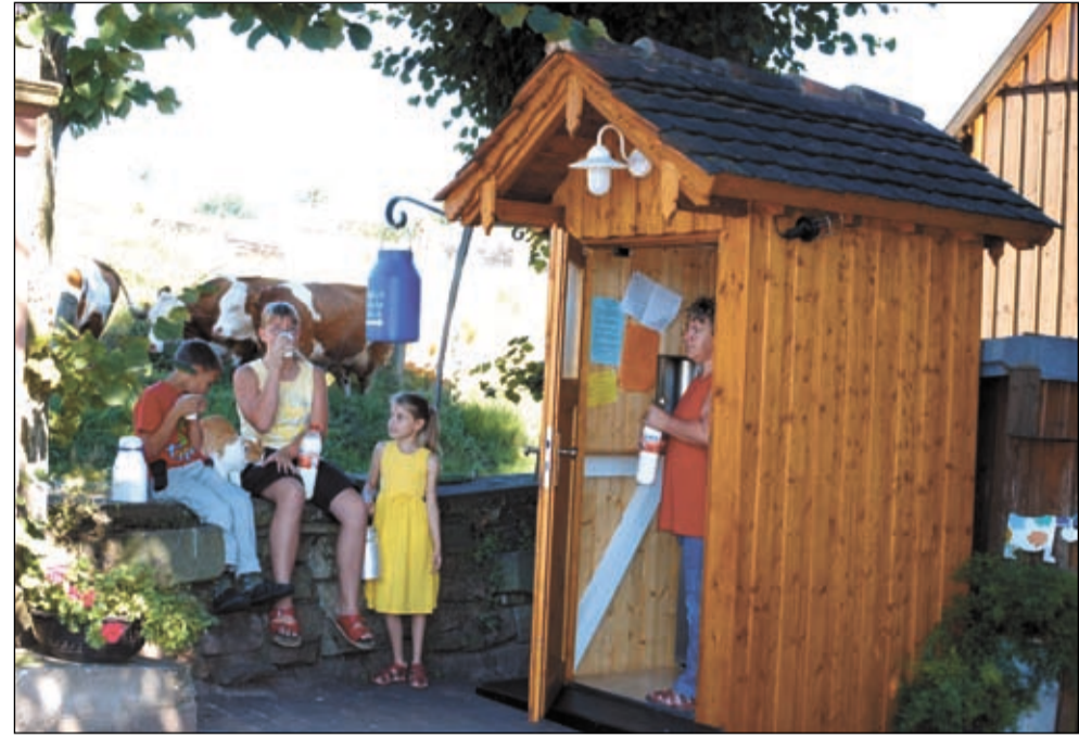
Wird gut angenommen: Die „Flotte Lotte“ in Beerfelden

Am Wanderweg mit dem blauen Kreuz gelegen, nutzen auch Fremde öfter die Ge-