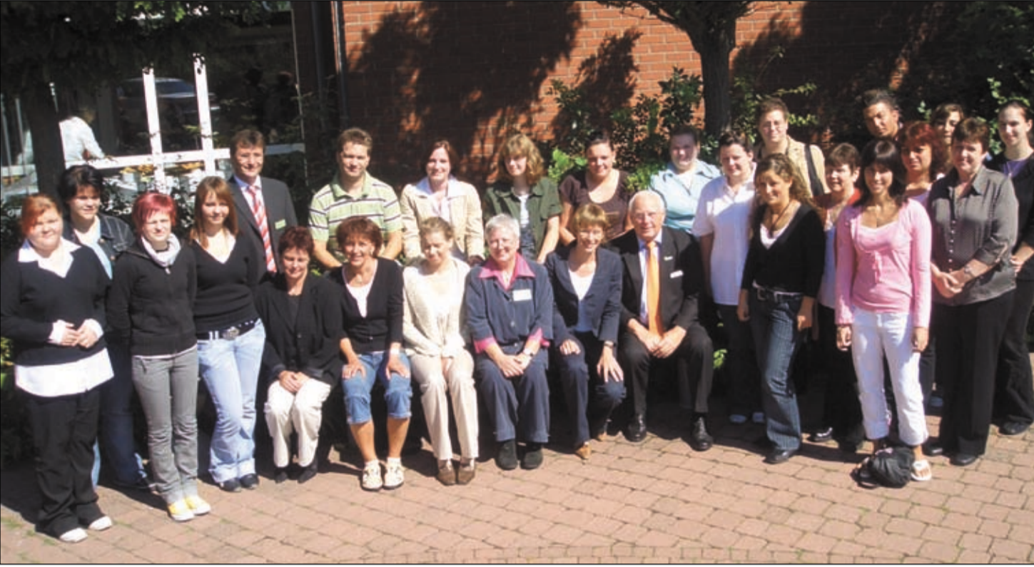
Sozialministerin Silke Lautenschläger mit den Verantwortlichen der Altenpflegeschule und des Gesundheitszentrums im Kreis der Schülerinnen und Schüler des neuen Altenpflegekurses

23 Teilnehmer haben am 1. August ihre Altenpflegeausbildung begonnen