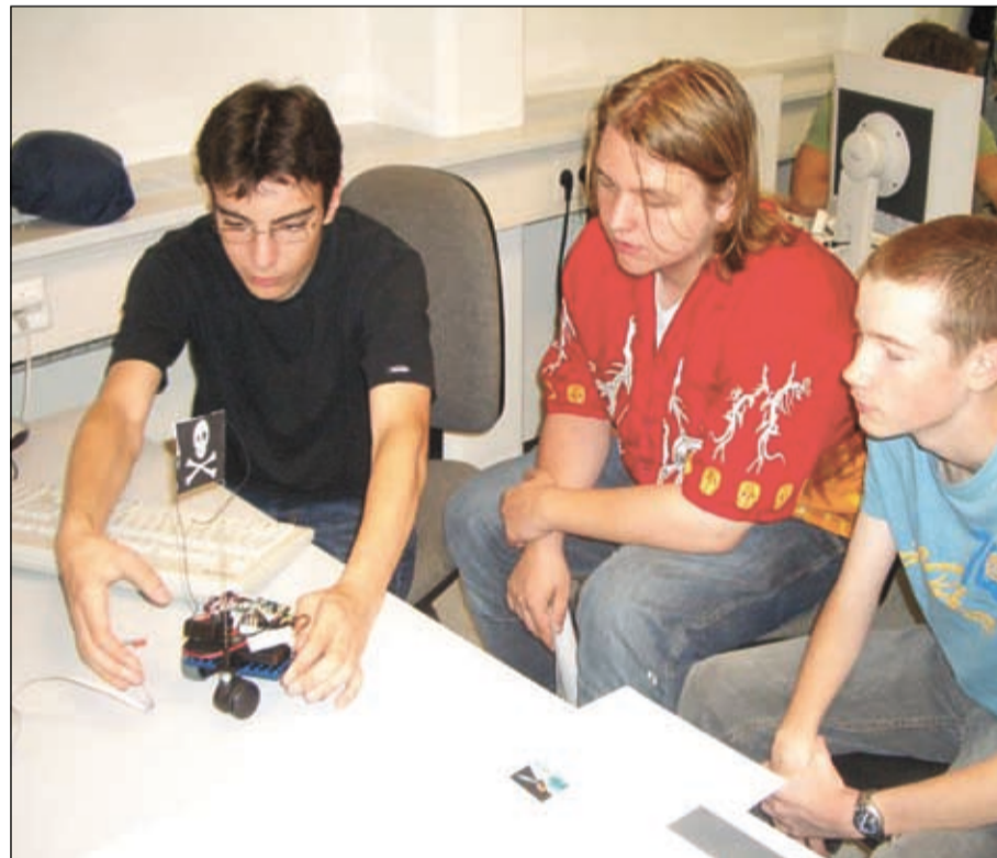
Im Team lernt's sich leichter: Teilnehmer des Roboter-Workshops der Beruflich Gymnasialen Oberstufe Michelstadt durften beim Fachbereich Elektro- und Informationstechnik an der TU Darmstadt ihre praktischen Fähigkeiten prüfen.

Die Aufgabenstellung war darauf ausgerichtet, dass einer der Roboter die Führung übernehmen sollte. Die anderen Robotik-