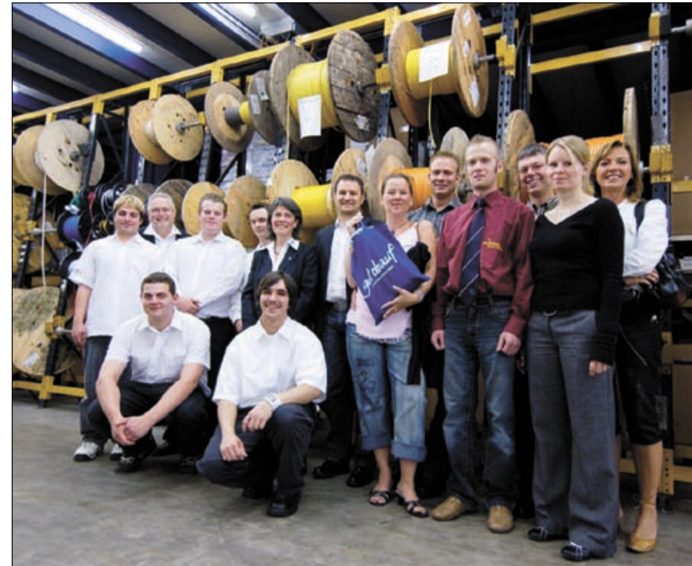
Das Foto zeigt die Teilnehmer des ersten gut drauf-Sommercamps sowie die Jäger Direkt-Geschäftsführung bei der Abschlusspräsentation

Angehende Elektrotechniker aus ganz Deutschland im Odenwald - bei Jäger Direkt Theorie und Praxis in Einklang gebracht